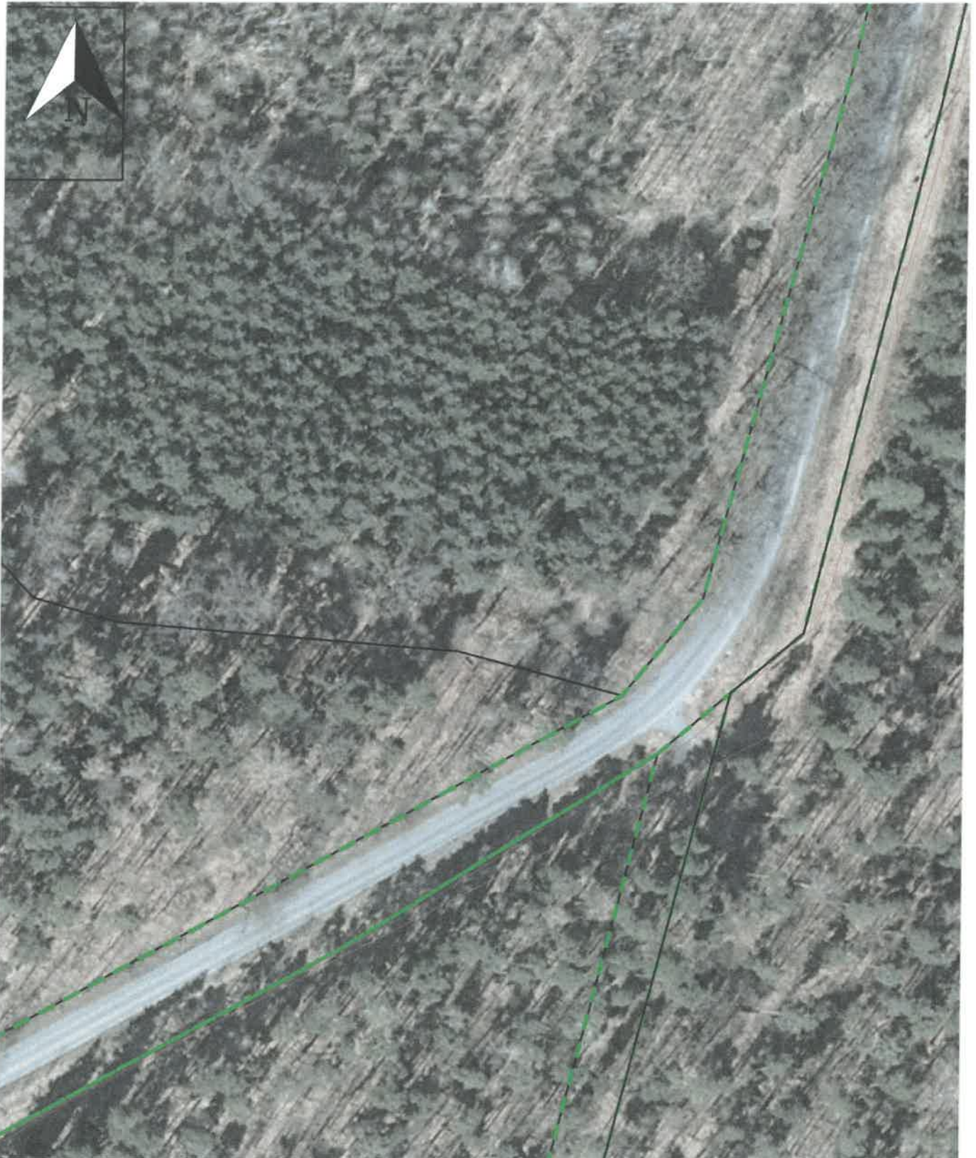
Brynek, Tworóg | Połomia, Tworóg